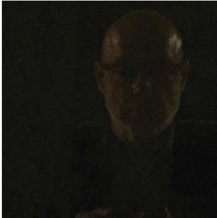
Portada disco Reflection (2017). Brian Eno