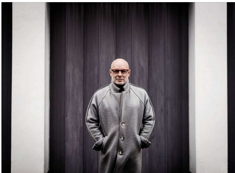
Brian Eno.

Brian Eno es un músico, compositor, artista visual y productor musical inglés (ha producido grupos como Talking Heads, David Bowie, U2 y Coldplay). Es conocido en todo el mundo como uno de los principales innovadores de la pintura generativa y de la música ambiente, género que él definió. La obra de Eno se dedica casi exclusivamente a las posibilidades que ofrece la luz como medio y sus instalaciones sonoras y visuales han ido redefiniendo los espacios arquitectónicos emblemáticos del mundo desde finales de 1970. Su obra se muestra con regularidad; de Tokio a Ciudad del Cabo, desde Río de Janeiro a Nueva York y de Londres a Madrid.