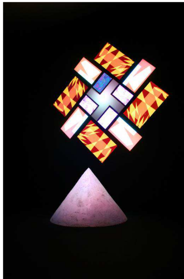
77 Million Paintings.

presentación de su último álbum, Reflection , en la sala de recogida de maletas de la Terminal 1 del Aeropuerto de Barcelona - El Prat, durante el mes de junio.