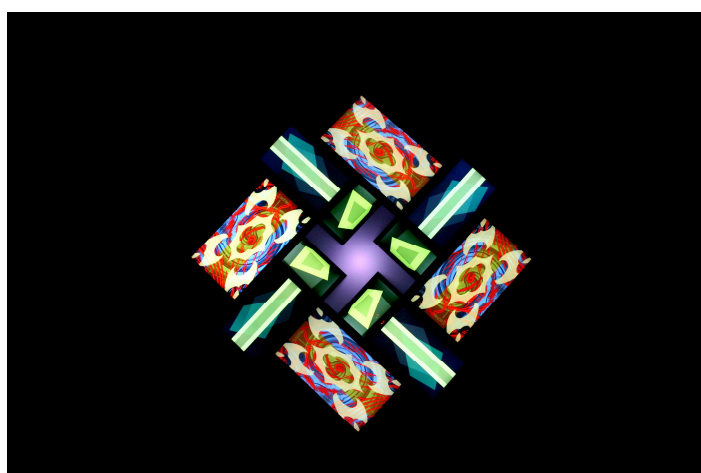
77 Million Paintings.

La icónica 77 Million Paintings de Brian Eno ocupará el nivel 2 del centro. Se trata de una gran instalación audiovisual generativa. Esto quiere decir que las imágenes y los sonidos que la componen evolucionan de manera indefinida, conforme a un seguido de normas que tienen cierta dimensión estadística (de manera que los resultados no pueden ser plenamente previstos por el artista) y que, a causa del gran número de combinaciones entre las formas, colores y sonidos resultantes, se renueva constantemente. De hecho, cada combinación de luz y sonido tardaría millones de años en repetirse. Según los cálculos de Eno, la pieza es capaz de producir alrededor de 77 millones de imágenes diferentes (de aquí el título de la pieza).