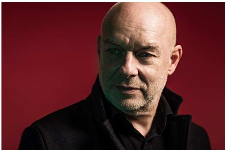
Brian Eno.