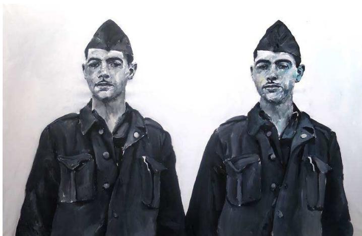
Santiago Ydáñez Harry Randall , 2016

8 pinturas acrílicas sobre tela, 200 x 300 cm 1 pintura acrílica de 180 x 200 cm